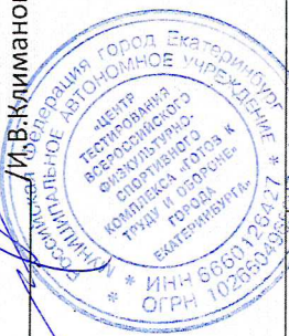
ГРАФИК ПРОВЕДЕНИЯ МЕРОПРИЯТИЙ